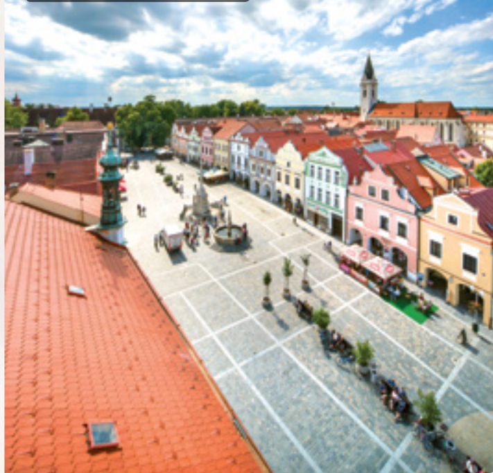
Pohled z ochozu věže staré radnice

Výstup na věž skýtá i další příležitosti pro zábavu a poučení . Cestou na ochoz si můžete povšimnout závaží, řetězů, háků a dalšího příslušenství ke starému mechanickému hodinovému stroji , který je sice stále funkční, ale odpočívá ve druhém patře věže. Práci dnes za něj vykonává stroj elektrický. Stará se o přesný čas na věžních hodinách i o pravidelné odbíjení dvou věžních zvonů .